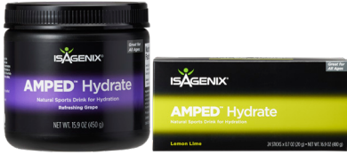
24개 들이 스틱형과 캐니스터형 판매