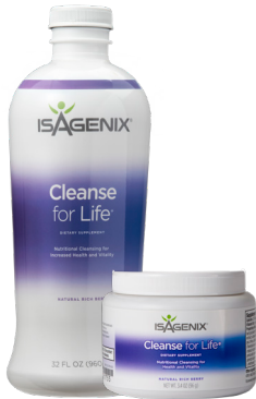
액상, 파우더, 2온스 병 타입 판매 중

클렌즈 포 라이프® - 천연 클렌징 효과를 내는 허브와 항산화물질이 풍부한 식물추출물이 시너지를 내도록 혼합한 제품으로 디톡스를 돕습니다.