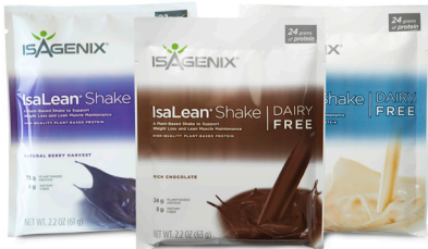
14개 들이 패키지만 판매

ISALEAN® 셰이크 유지방 0% - 풍부한 영양을 가진 식사대용 제품으로, 건강 유지에 필수적인 유지방 0%, 양질의 식물성 단백질, 에너지를 높이는 탄수화물, 좋은 지방, 오랜 포만감 유지를 위한 섬유소를 제공합니다.