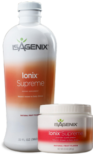
파우더, 액상, 일회용 팩트 판매 중