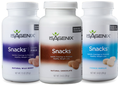
유지방 0% 제품 선택 가능