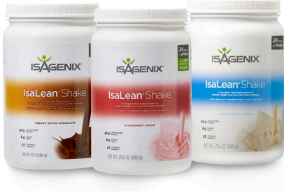
14개 들이 패키지 판매 중 코셔- 캐니스터형 1종만 판매

ISALEAN® 셰이크 - 맛있고 간편하며, 영양학적으로도 완벽한 식사대용 제품입니다. 가격도 끼니 당 3달러 정도입니다.